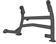
1 Hauptständer Centre Stand