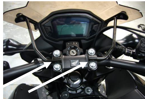
Foto 2 Schrauben die entfernt und ersetzt werden