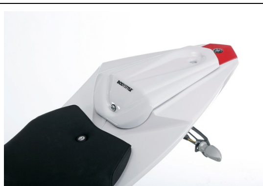
Yamaha YZF-R125 / MT-125