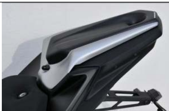
Yamaha YZF-R25/R3 / MT-25/03