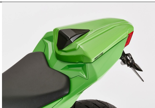
Kawasaki Z 300