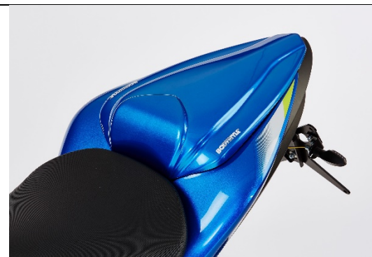
Suzuki GSX-S 1000/F